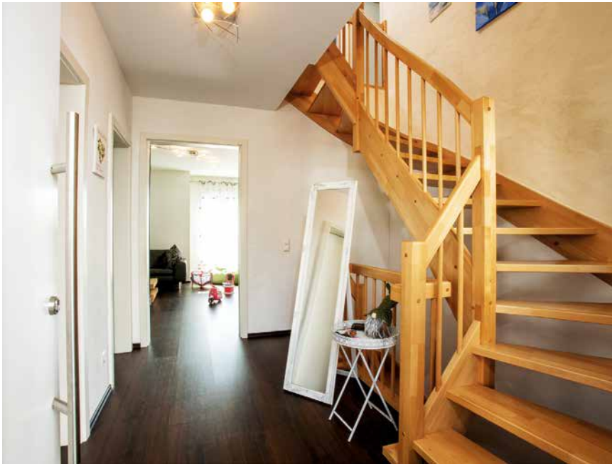
Eine halbgewendelte Treppe verbindet Erd- und Obergeschoss.

einzigste, was wir im Laufe der Jahre veränderten, war die Raumnutzung.“ Dabei kam ihnen zugute, dass sie in weiser Voraussicht einen Vollkeller in Auftrag gegeben hatten, mit Lichtschächten und Heizung, also quasi eine Ausbaureserve zum Wohnen. So diente der Keller zuerst als geräumige Lagerfläche, dann als Fitnessraum, später richteten die Hausherren hier unten ein schickes Büro ein.